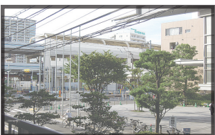
バルコニーからの景色 (京急蒲田駅が見えます)