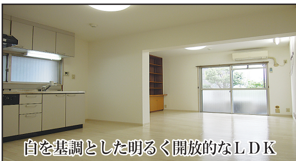
白を基調とした明るく開放的なLDK